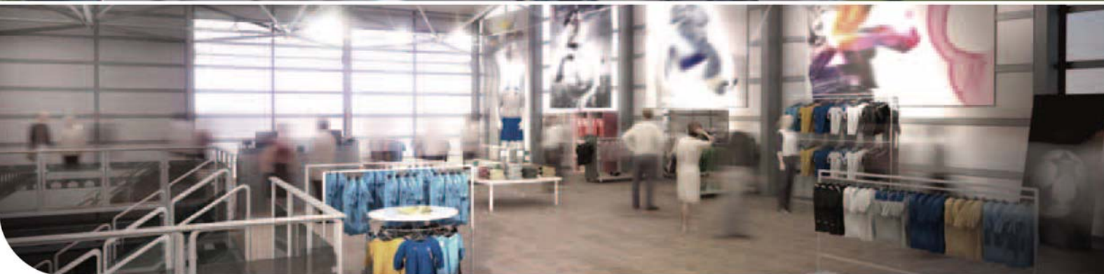
Es gibt immer eine passende Raumgröße