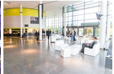
TAGUNGSBÜRO / CONFERENCE OFFICE