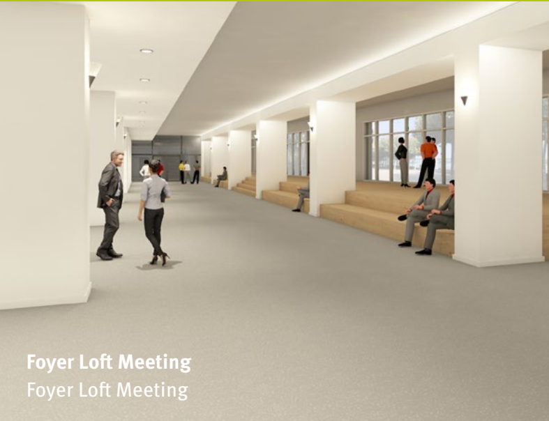
Foyer Loft Meeting Foyer Loft Meeting