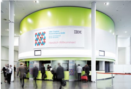
TEILNEHMERHANDLING / ATTENDEE MANAGEMENT