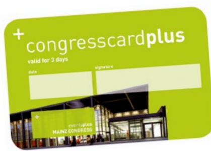
CONGRESSCARDPLUS / CONGRESSCARDPLUS