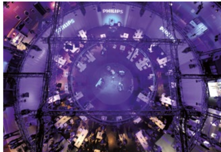
TECHNIK / EQUIPMENT