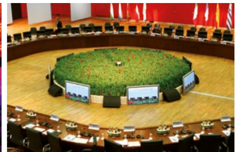
GRÜN TAGEN / GREEN MEETINGS