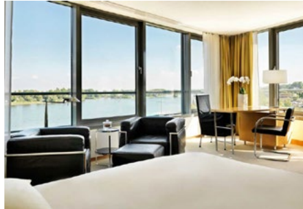
HOTELZIMMER / HOTEL ROOMS