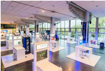
AUSSTELLERHANDLING / EXHIBITOR MANAGEMENT