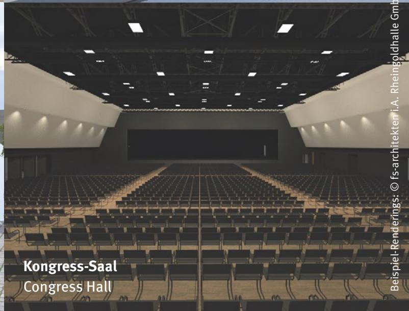
Kongress-Saal Congress Hall