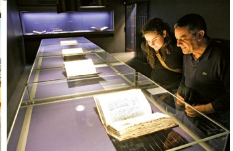
RAHMENPROGRAMM / SIDE PROGRAMME