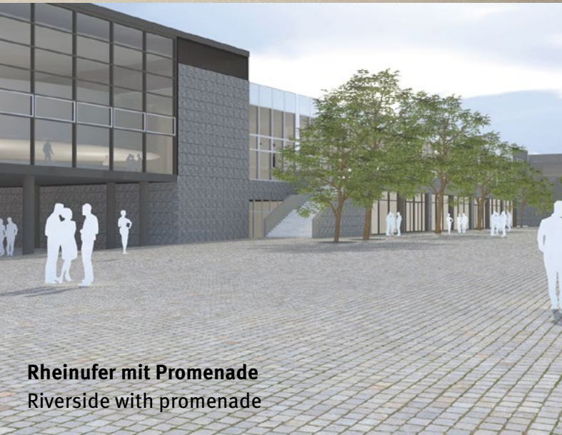
Rheinufer mit Promenade Riverside with promenade