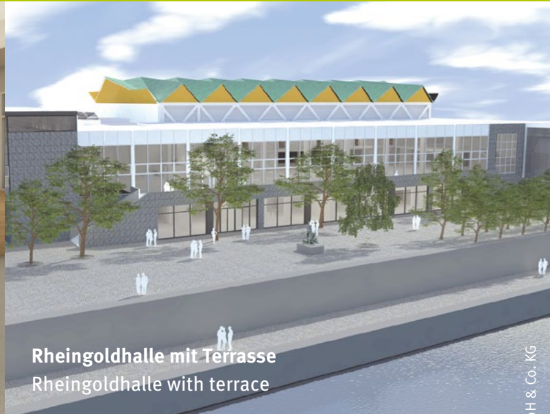
Rheingoldhalle mit Terrasse Rheingoldhalle with terrace