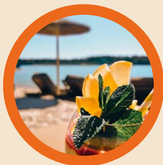
Show Barkeeper + Cocktail Pauschale

Entdecken Sie unsere exklusiven Zusatzangebote, darunter Show-Barkeeper, Team-Building, Aqua Park, Live-Cooking und Massage Service. Dies ist nur eine Auswahl an Möglichkeiten, um Ihre Veranstaltung zu bereichern. Lassen Sie uns Ihre Traumveranstaltung planen.