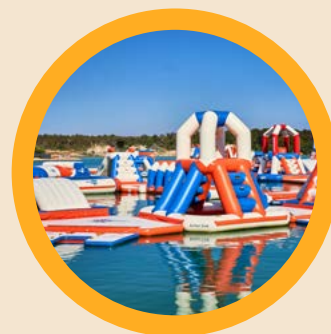
Aqua Park & Wasseraktivitäten