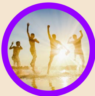
Team Building Angebot