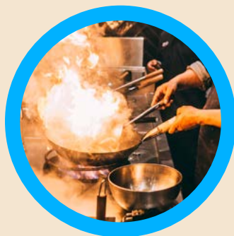
Live Cooking Stationen